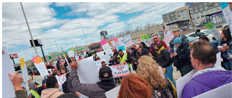
レストランチェーン店(portillos)の労働者のストライキ支援行動

次号ではいよいよ実際のレイバーノーツのワークショップと全体会の様子、そこから学んだ教訓についてご報告します。