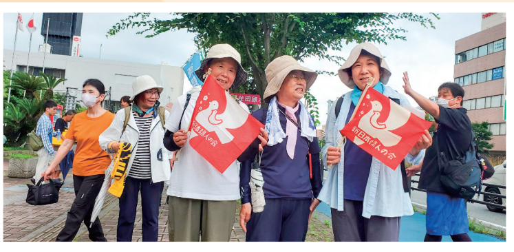
大牟田行進（新婦人の皆さん）