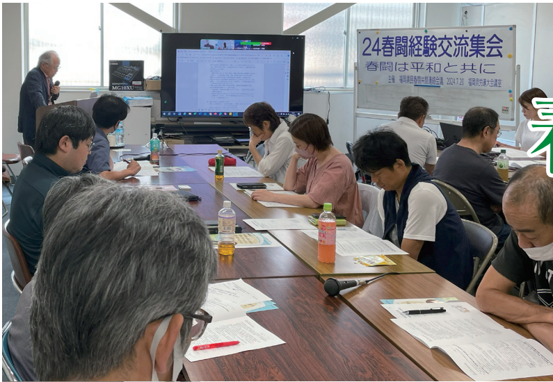
中身の濃い講演を真剣に聞く参加者の皆さん