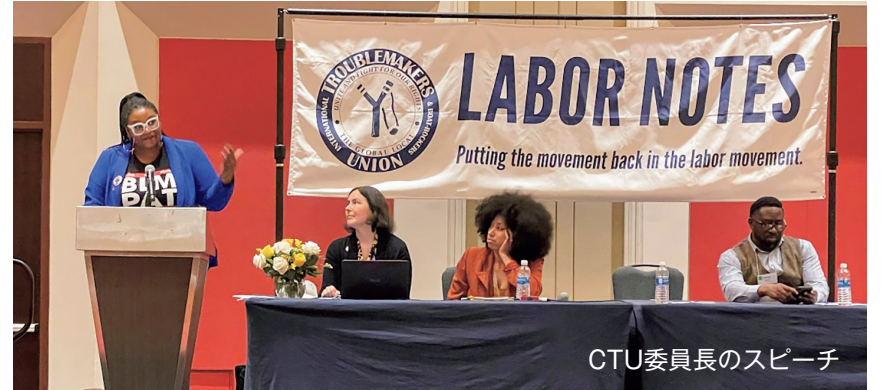
CTU委員長のスピーチ