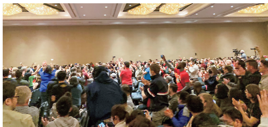
会場総立ちで拍手でたたえる様子

A、組織化するときみんなが労働者になりたいというわけではなかった。主な要求は会社に物申したいということだった。そのため意思統一をしなければならなかった。対話をしてみると大多数は労働者になりたいということだったのでその要求で一本化した。鍵かっこつきの独立・自立であり中身は労働者、私たちには労働者としての権利があると伝えている。