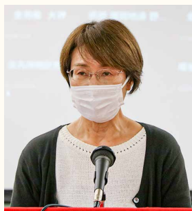
建交労からの発言（抜粋）

4月18日、警固公園に40人で集まって集会を開き、マスコミにも取材されました。集会では今回の改定では賃上げにつながらないことを訴えました。 今回の改定で創設されたベースアップ評価料は病院の機能によって率が違うことや事務は対象にならないことなど、病院間や職種間の差別につながるものとなっています。また、ベースアップ評価料についての回答がでない支部や手当てで支給するところなど対応も様々になりました。 でも、今回の改定では全く人手不足解消にはなっていません。福岡県医労連では再改定をもとめ運動を進め、県にも看護増員の要請を行う予定にしています。