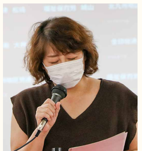
医労連からの発言（抜粋）

組織を強く大きくしよう」と力強い発言がありました。 最賃引上げの運動では、福岡地区労連より最低賃金の自治体意見書採択運動は個人の活動から組織の運動に変わったと取り組みを総括した発言がありました。県国公からは人事院勧告が32年ぶりの2%水準となったこと、長年要求してきた特急料金の全額支給について実施されることになったとの報告がありました。