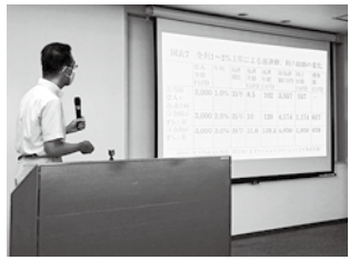
関野下関市立大学教授

現在、家計の借り入れの増大が顕著であり、中でも若年世代の借入金的大幅な増加に注視する必要があります。30代では住宅ローンなどを変動金利で借入している怖さがあり、20代では年収に対する借入金の割合が130%