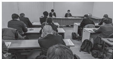
九州市長会要請・懇談