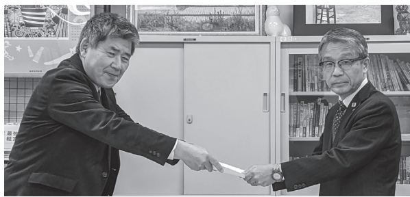
中小企業家同友会を訪問

18回の法廷を積み重ねてきた「年金切り下げ違憲訴訟」は、2月10日に結審しました。年金者組合執行委員長が、原告と組合員を代表して意見陳述を行いました。判決は、5月15日(金)15時からです。多くの方の傍聴を。