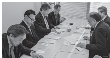
九州経営者協会要請・懇談

院九州事務局、九州防衛局を訪問。福岡春闘共闘と県労連・地区労連は、21日には中小企業家同友会、福岡県労働政策課、九州(福岡)経営者協会、福岡地域の10の自治体などを訪問し、要請書を手渡し、「最低賃金を全国一律1500円に」「地域間格差正規と非正規の均等待遇」などの懇談を行いました。