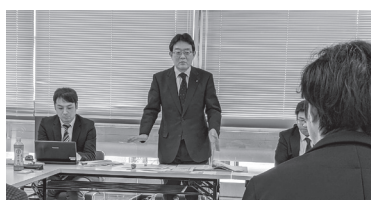
九州知事会要請・懇談

20春闘は、3月11日の回答指定日と翌日のストライキを含む統一行動を軸にいよいよ本番に入りました。郵政産業労働者ユニオンは、2月14日に「均等待遇を求めて」全国一斉154人が裁判所に提訴を行い、3月17日にストライキに突入します。 全労連九州ブロックは、1月27日に九州市長会、28日に九州知事会と懇談を、2月12日には、九州財務局、九州農政局、九州町村会など、13日には九州経済産業局、福岡労働局、九経連、20日には人事