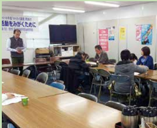
長久事務局長から今後の組合活動の助けになるお言葉をいただきました

2019年度のわくわく講座は7月7日に開講式を行ったのに引き続き、9月15日・10月5日・12月15日と講師に下関市立大学関野教授を 招いてスクーリングを行ってきました。そして1月12日に締めくくりとなる閉講式を、岡山県労働者学習協会長久事務局長を招き行いました。