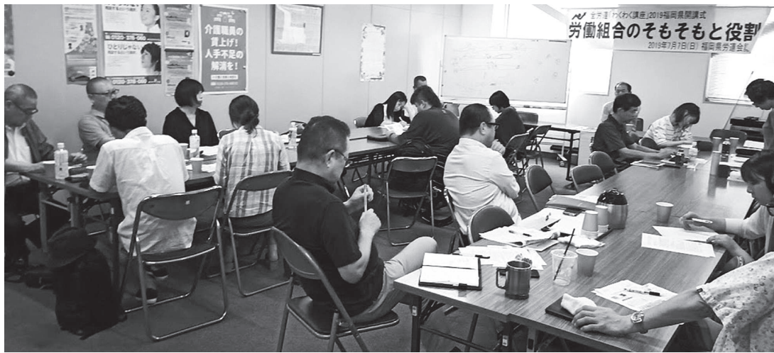
4つのグループに分かれて、「労働組合とは？」を改めて確認

低賃金の大幅な引き上げは、今や大きな政治課題となってきました。早く1500円に 福岡県労連と加盟単産・単組では、最低賃金の大幅引き上げを求める署名に取り組み、意見書とともに福岡労働局、福岡地方最低賃金審議会に提出しました。また、福岡県知事への要請や最低賃金審議会の傍聴、毎月の宣伝行動にも取り組んでいます。「全国一律最低賃金今すぐ1000円、早く1500円に」の世論と運動をさらに大きく広げ、最低賃金の大幅引き上げを勝ち取っていきましょう。