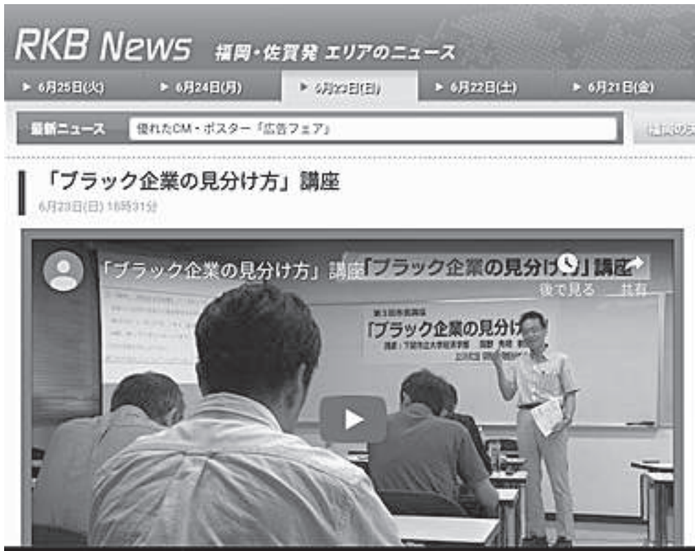
当日の様子は RKB 毎日放送のニュースで放送されました